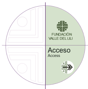
EJE VERTICAL ordenamiento de la información a la izquierda - a la derecha