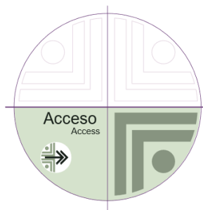
EJE HORIZONTAL ordenamiento de la información arriba, adelante - abajo, cerca