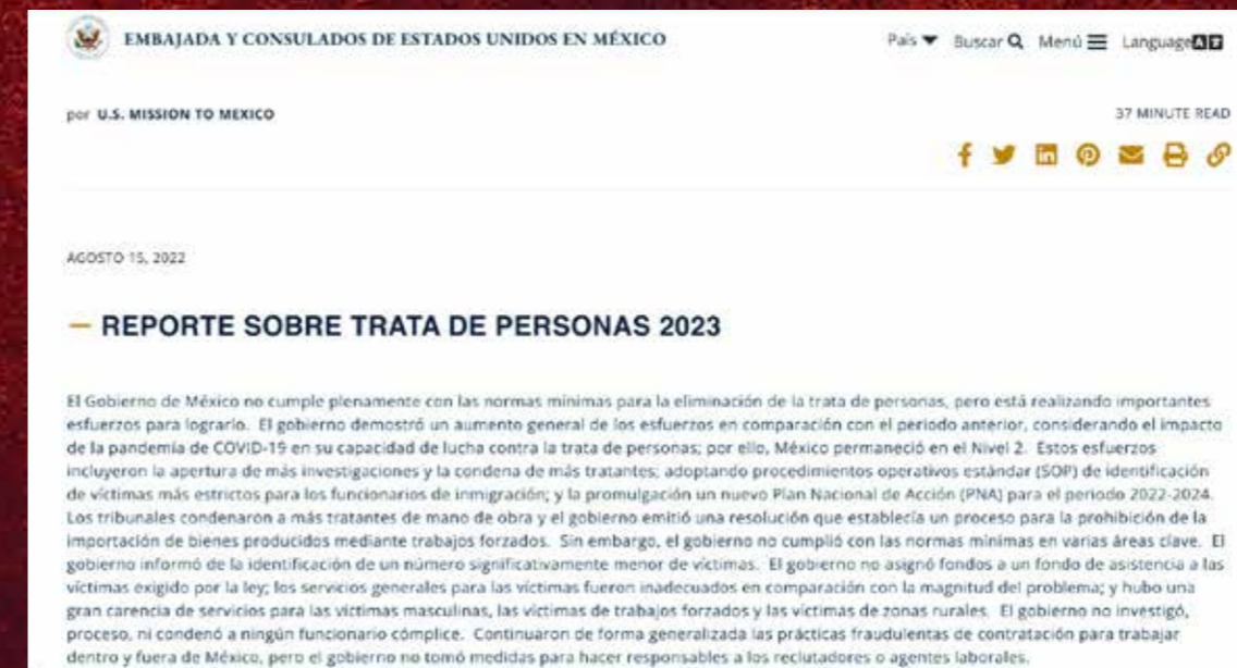
El gobierno de Estados Unidos, a través de su Embajada y Consulados acusó a las autoridades mexicanas de no cumplir con las normas mínimas para eliminar la trata de personas